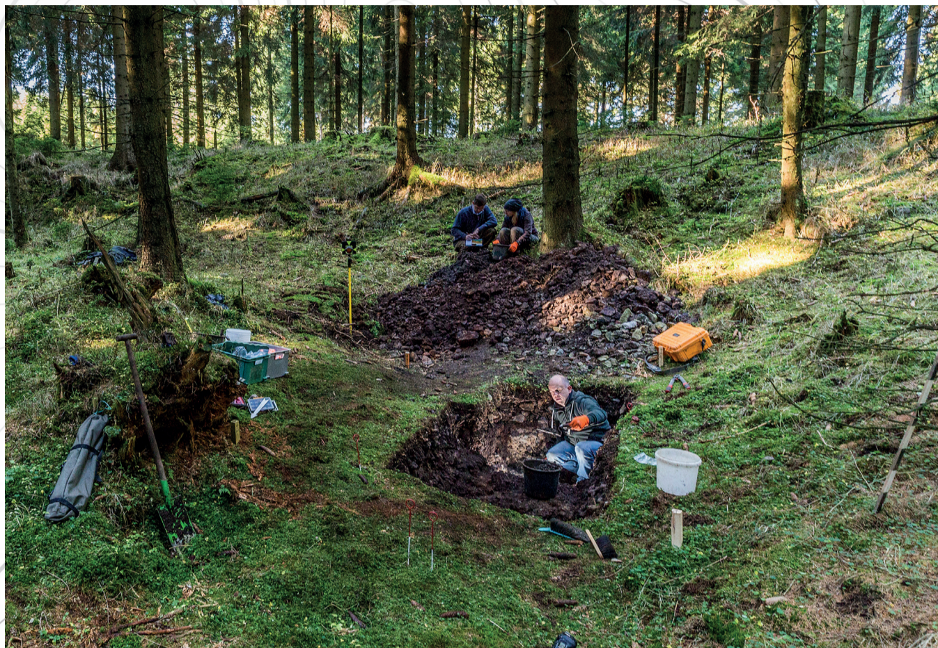
Montanarchäologische Untersuchungen im bronzezeitlichen Abbauareal der Zinnseife bei Schellerhau

Montánně-archeologický výzkum rýžoviště cínu z doby bronzové poblíž Schellerhau